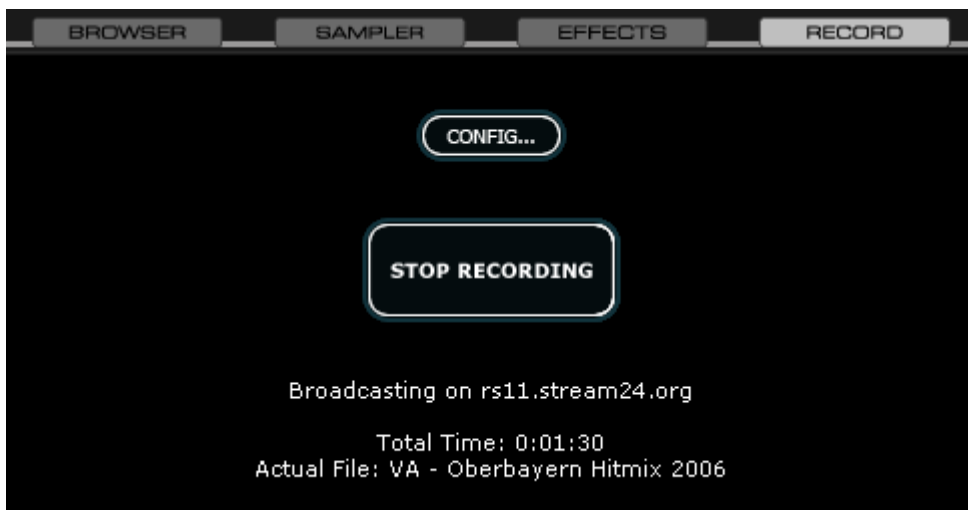
Abb. 5 VirtualDJ Broadcast (Ausschnitt)

War die Verbindung zum Streamserver erfolgreich, so siehst du u. a. wie der Counter mit dem Hochzählen der Sendedauer beginnt.