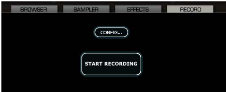
Abb. 4 VirtualDJ Record Start (Ausschnitt)

Klicke nun auf den [START RECORDING] Button, um mit der Übertragung des Streams zu beginnen.