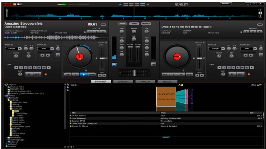
Abb. 1 VirtualDJ Startbild

Starte deinen VirtualDJ und du siehst folgendes Fenster: